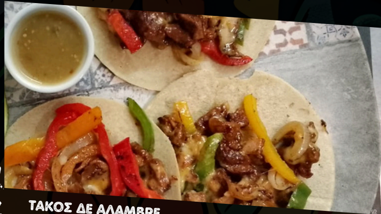
ΤΑΚΟΣ ΔΕ ΑΛΑΜΒΡΕ

Από το κέντρο του Μεξικό. Τρυφερό Μοσχάρι, Λωρίδες Μπέικον, Τυρί Τσένταρ και κόκκινη ή πράσινη καραμελωμένη πιπεριά και κρεμμύδια.