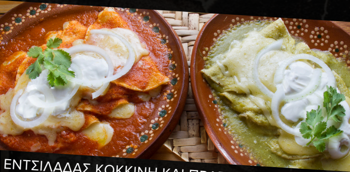
ΕΝΤΣΙΛΑΔΑΣ ΚΟΚΚΙΝΗ ΚΑΙ ΠΡΑΣΙΝΗ

4 Τορτίγιες Καλαμποκιού, Γεμιστές με Κοτόπουλο, βουτηγμένο σε Σπιτική Κόκκινη Σάλτσα, Λιωμένο Τυρί, Μαρούλι και Γιαούρτι. Ζητήστε Πικάντικη Σάλτσα αν θέλετε.