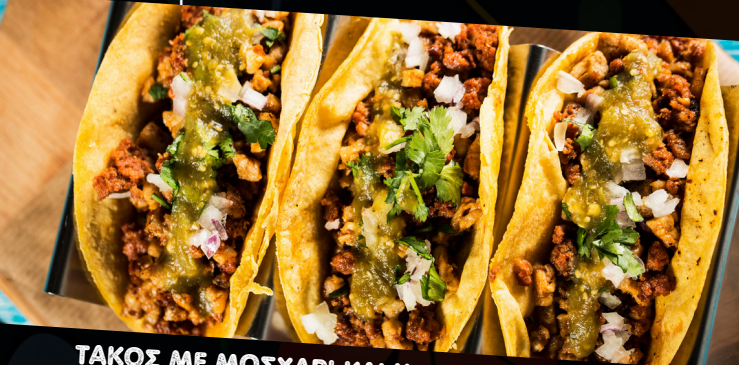
ΤΑΚΟΣ ΜΕ ΜΟΣΧΑΡΙ ΚΑΙ ΧΟΙΡΙΝΟ

Από το Κεντρικό Μεξικό. Τρυφερό Μοσχαρίσιο Κρέας και Σπιτικό Λουκάνικο Τσορίθο.