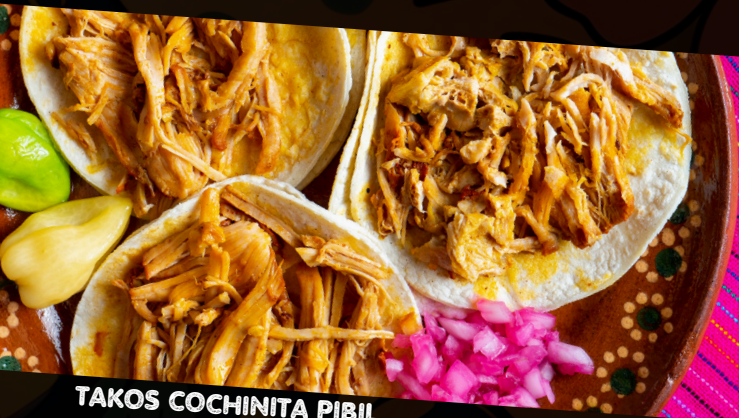
ΤΑΚΟΣ COCHINITA PIBIL