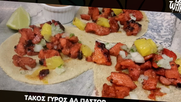
ΤΑΚΟΣ ΓΥΡΟΣ ΑΛ ΠΑΣΤΟΡ